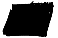
Director Services Smiths Medical Deutschland GmbH