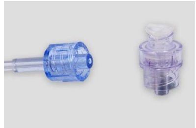
Abbildung einer geschlossenen Hubvorrichtung