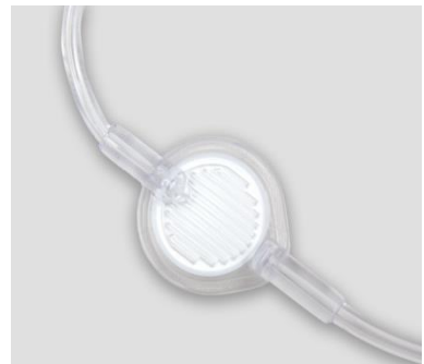
Abbildung eines 0,2-Mikron-Inline-Filters