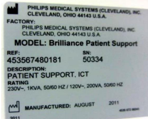
Abbildung 2 (Beispiel: fünfstellige Seriennummer):

CT-Tische in den folgenden sechsstelligen Seriennummernbereichen sind betroffen: