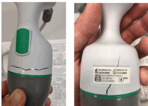
Abbildung 1: Beispiel für einen Schallkopfgriff mit Rissen

BladderScan, BladderScan Prime Plus, Verathon und das Verathon Fackel-Symbol sind Marken von Verathon Inc. ©2020 Verathon Inc. LTR-0051-DEDE Rev-00