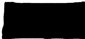
Beschwerdemanagement OPM Deutschland