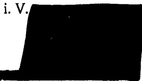
Leiter Customer Management Innendienst OPM Deutschland