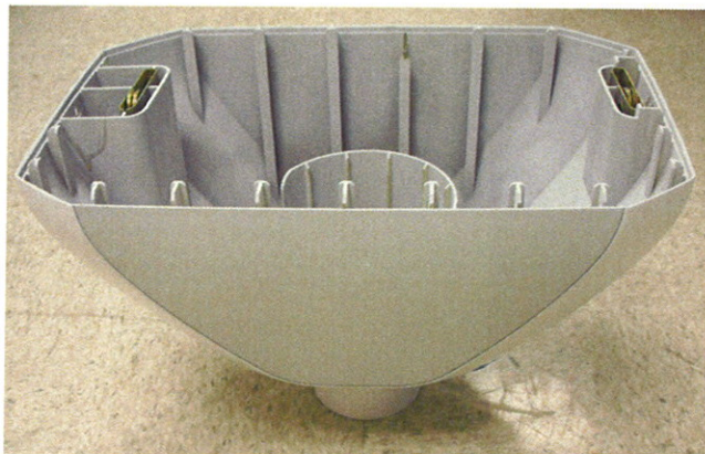
Abbildung 1: LINAC und unteres Gehäuse mit Riegeln an beiden Seiten